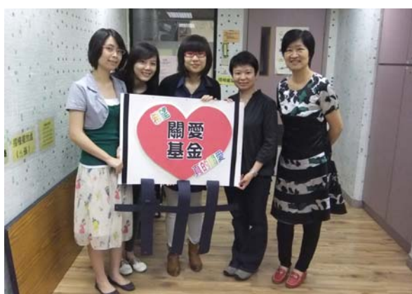
F20110502 關愛基金何來關愛記招