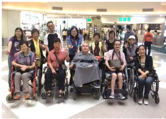
F20111022 九龍東遊歷奧海城暨茶聚