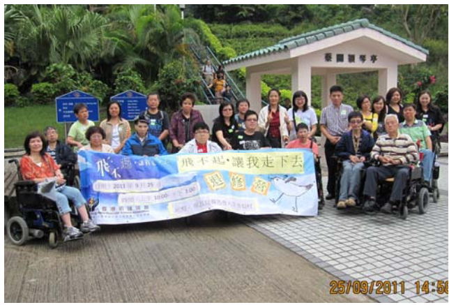
F20110925 飛不起讓我走下去退修營